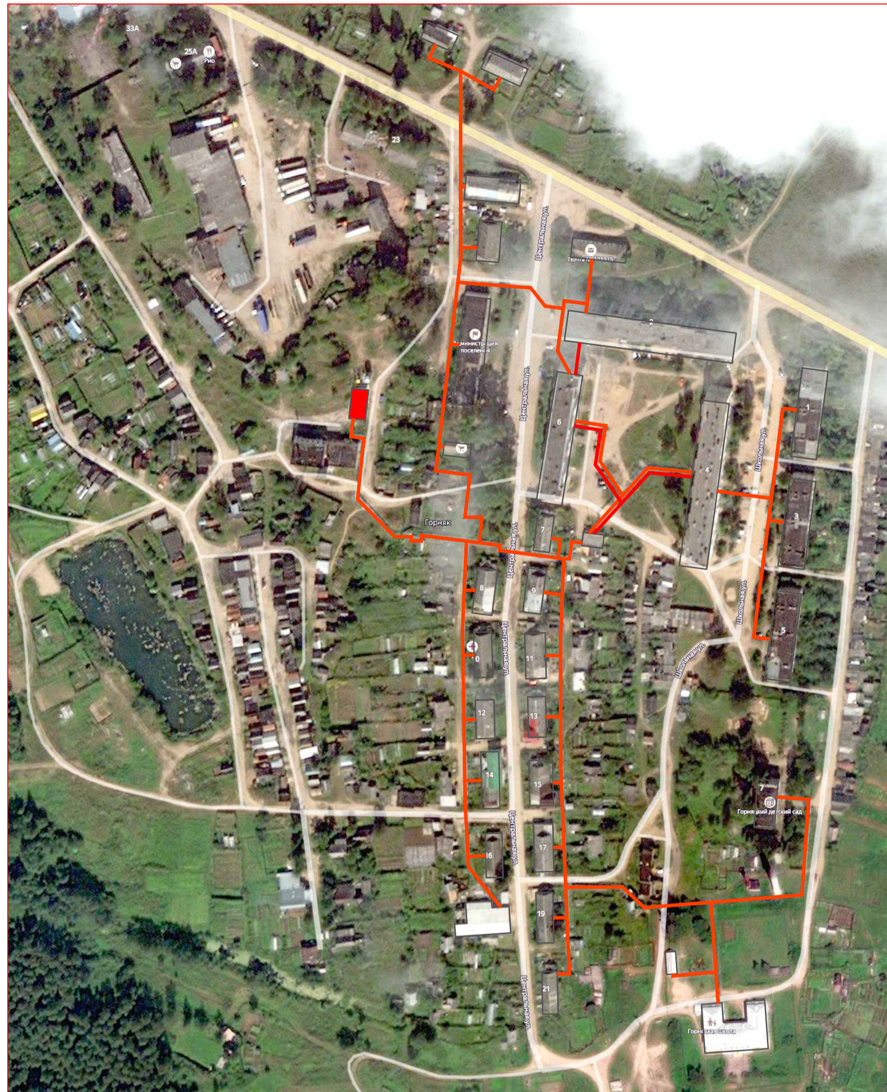
Схема теплоснабжения п. Горняк - фрагмент территории, М 1:1000