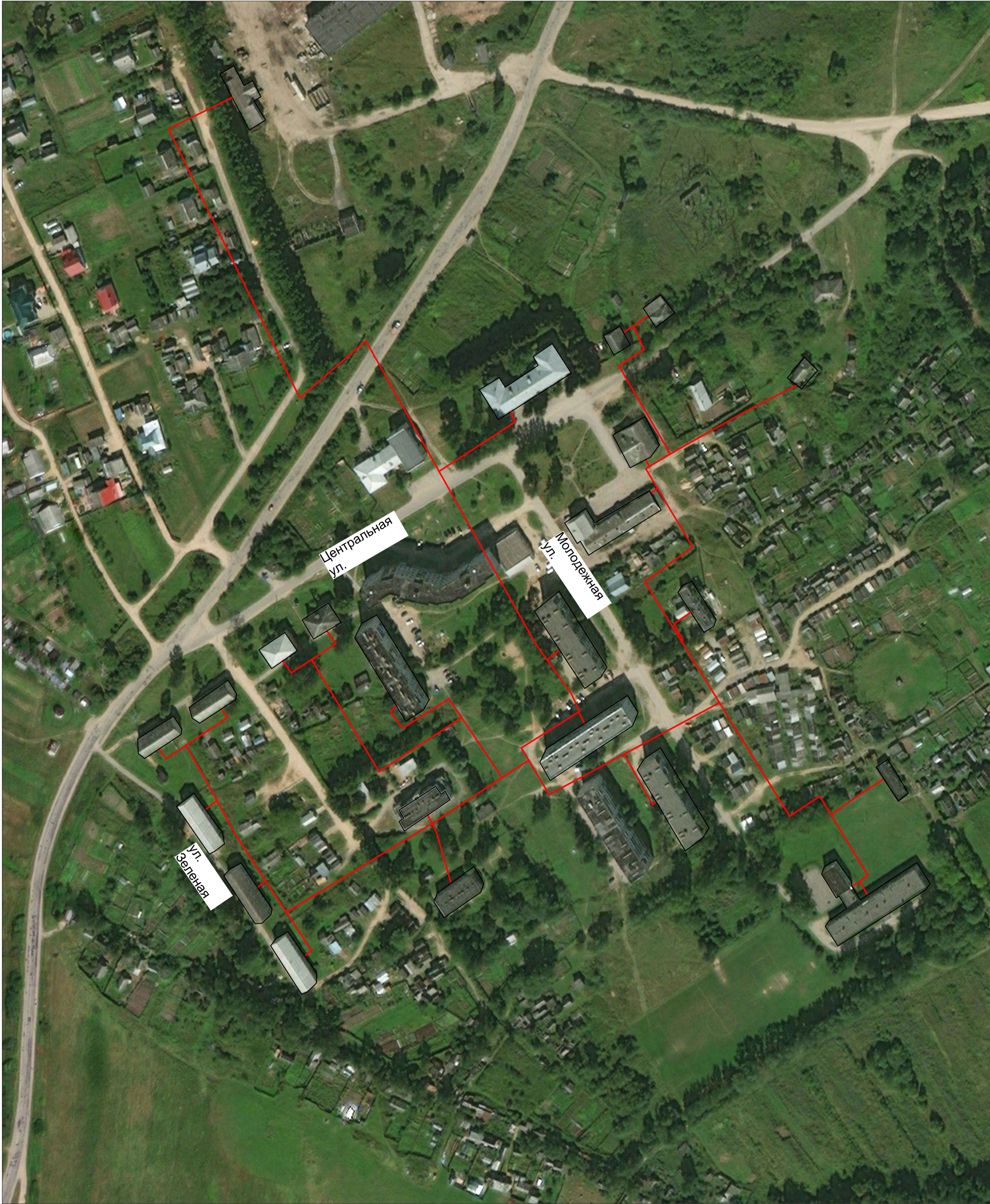
Схема теплоснабжения п. Солнечный - фрагмент территории, М 1:1000