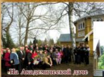
На Академической даче