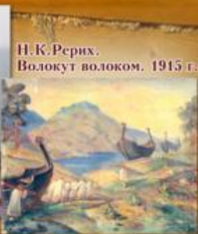
Н.К.Рерих. Волокнут волоком. 1915 г.