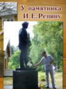
У памятника И.Е.Репину