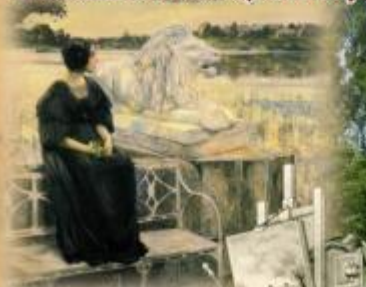
И.И.Борисовский. На террасе. 1906

ЗДЕСЬ НЕОДНОКРАТНО ЖИЛ И РАБОТАЛ ВЕЛИКИЙ РУССКИЙ ХУДОЖНИК ИЛЯ ЕФИМОВИЧ РЕПИН